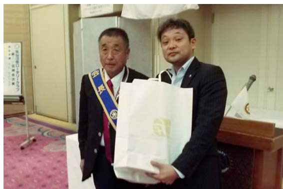
気仙沼プラザホテルにて気仙沼南RCの例会出席 お土産の交換贈呈