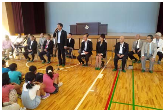
鹿折小学校訪問での歓迎会（体育館にて）