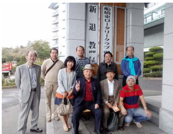
秋保温泉 緑水亭（宿）