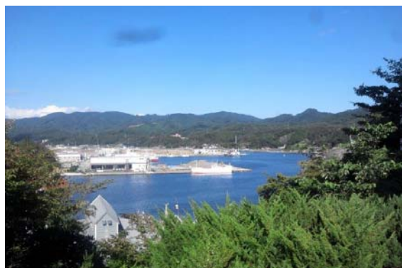
プラザホテルより気仙沼港を望む