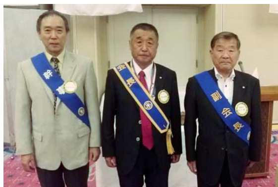
気仙沼南RC 会長・副会長・幹事 の3役